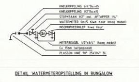
DETAIL WATERMETEROPSTELLING IN BUNGALOW